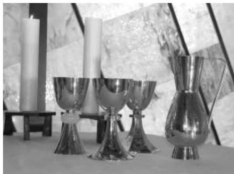
Jetzt passen endlich alle Kelche zusammen: Der neue Kelch steht in der Mitte.

Großzügige Spenden haben es möglich gemacht.