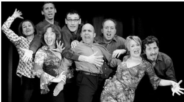
Das Ensemble des fastfood theater München

Die preisgekrönte Gruppe „fastfood“ gibt ein Gastspiel