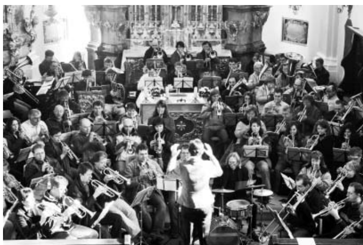
Am 8. März werden die Bläser die Kirche in Alteglofsheim mit mitreißenden Klängen füllen.

Der Landesverband evangelischer Posaunenchöre zu Gast in Alteglofsheim