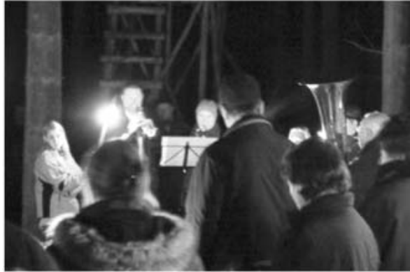
Fackelschein und Bläserklänge: Die Waldweihnacht in Alteglofsheim.